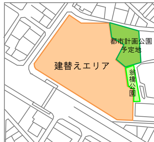
市民会館の敷地図

老朽化した市民会館を、堺らしい新たな文化を創造し、南大阪における文化芸術の創造、交流、発信の拠点となる施設に建替え。