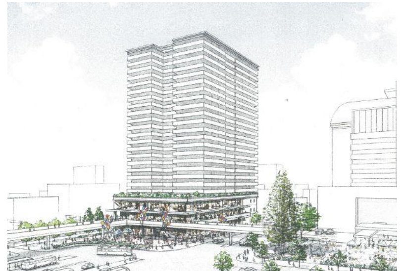
イメージスケッチ

堺東駅周辺地域の活性化を図るため、既存のジョルノビルを商業施設、住宅施設、駐車場施設を組み合わせた新たな建物へと建替える。