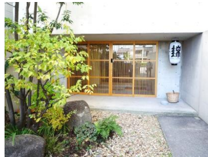
⑥ 宿泊施設 (平成28年)