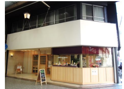
⑧ 飲食店舗 (平成29年)