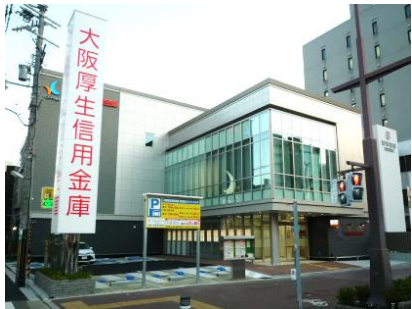
⑤ 信用金庫 (平成28年)