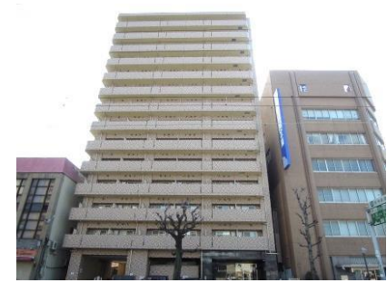
⑫ 集合住宅 (平成24年)