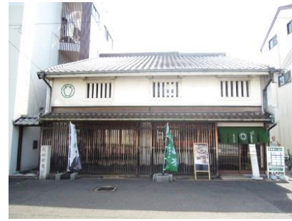
③ 飲食店舗 (平成25年)