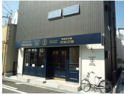
⑩ 刃物店舗 (平成28年)