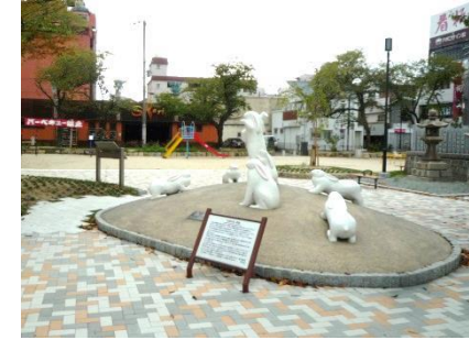
⑯ 宿院町公園 (2期工事中)