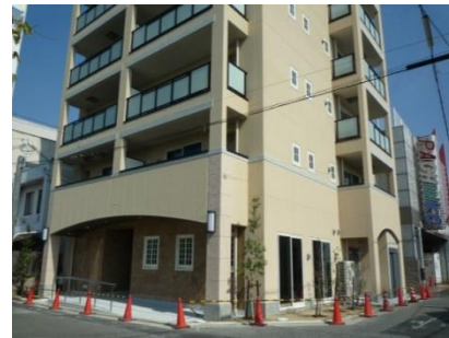
⑭ サービス付高齢者住宅 (工事中)