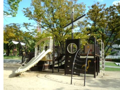
⑮ ザビエル公園 (平成29年)