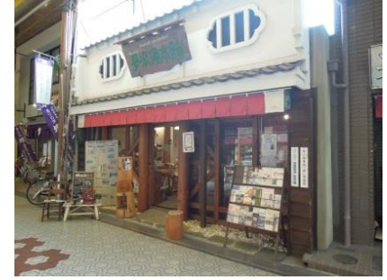
④ 飲食店舗 (平成25年)