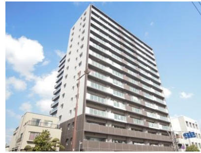
⑪ 集合住宅 (平成25年)