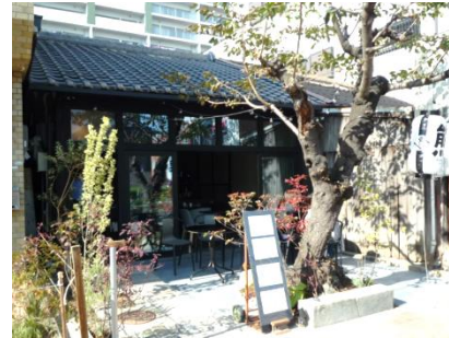
⑦ 飲食店舗兼宿泊施設 (平成28年)