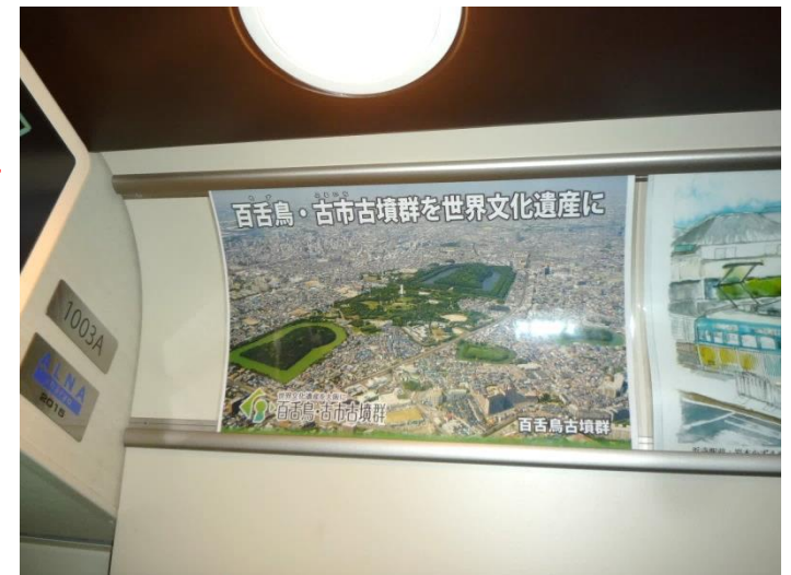
堺トラム車内広告掲示