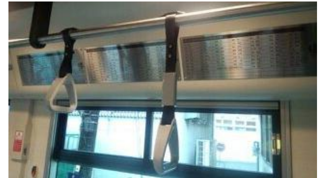
(参考) 堺トラム車内銘板