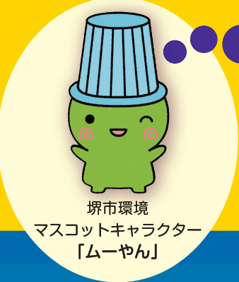
堺市環境 マスコットキャラクター 「ムーやん」