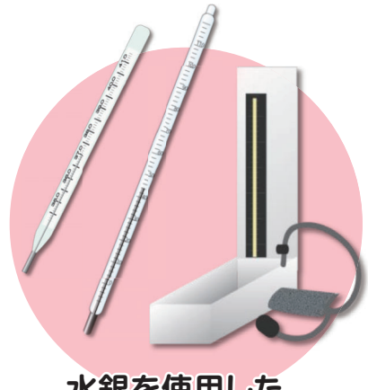
水銀を使用した 体温計・温度計・血圧計