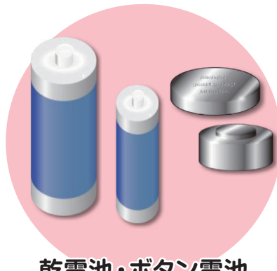
乾電池・ボタン電池