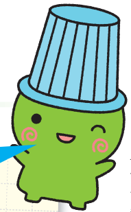
堺市環境マスコットキャラクター「ムーやん」