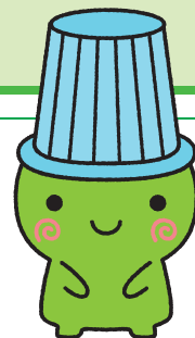
堺市環境マスコットキャラクター「ムーヤン」