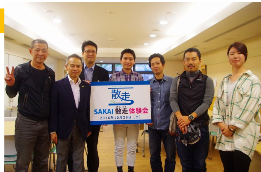
SAKAI散走フォーラム&体験会