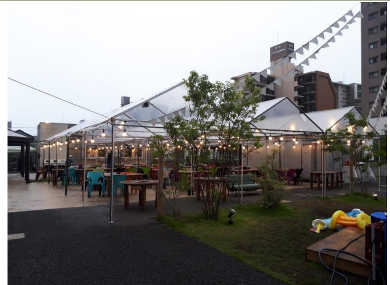
イメージ図 (高崎フィールドバンケット)

平成31年度 400万円 事業採算性調査 国補助率2/3 市補助率1/6 平成32年度 国の補助金等を活用し、施設工事を実施