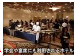
学会や宴席にも利用されるホテル