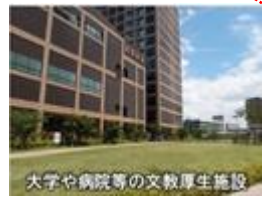
大学や病院等の文教厚生施設