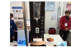
地域健康データシステム構築 (H33頃～)