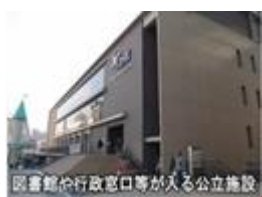
図書館や行政窓口等が入る公立施設