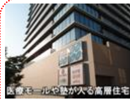
医療モールや塾が入る高層住宅