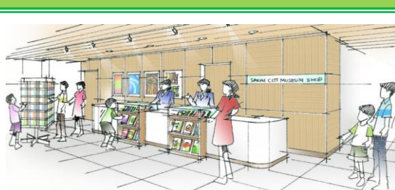
ミュージアムショップコーナーの新設

②展示場：ガイダンス施設に密接に関連する古代常設展示を更新整備します。仁徳天皇陵古墳をはじめとする百舌鳥・古市古墳群に関する模型や航空写真などをリニューアルし、実物資料の展示解説パネルなども最新の調査研究成果を反映するだけでなく分かりやすい内容に変えていきます。