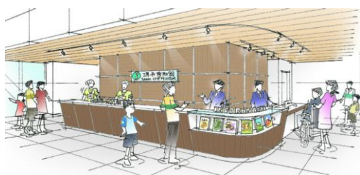
受付案内カウンターの移設

①ロビー：館内ロビー中央部分に百舌鳥古墳群ガイダンス施設が設置されるのに合わせて、受付案内カウンターの移設、ミュージアムショップコーナーの新設を行います