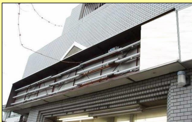
壁面広告の落下事例