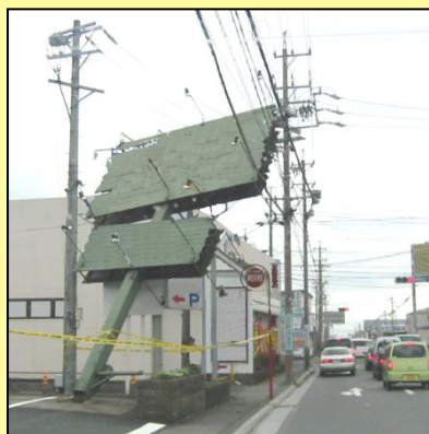
広告塔の倒壊事例