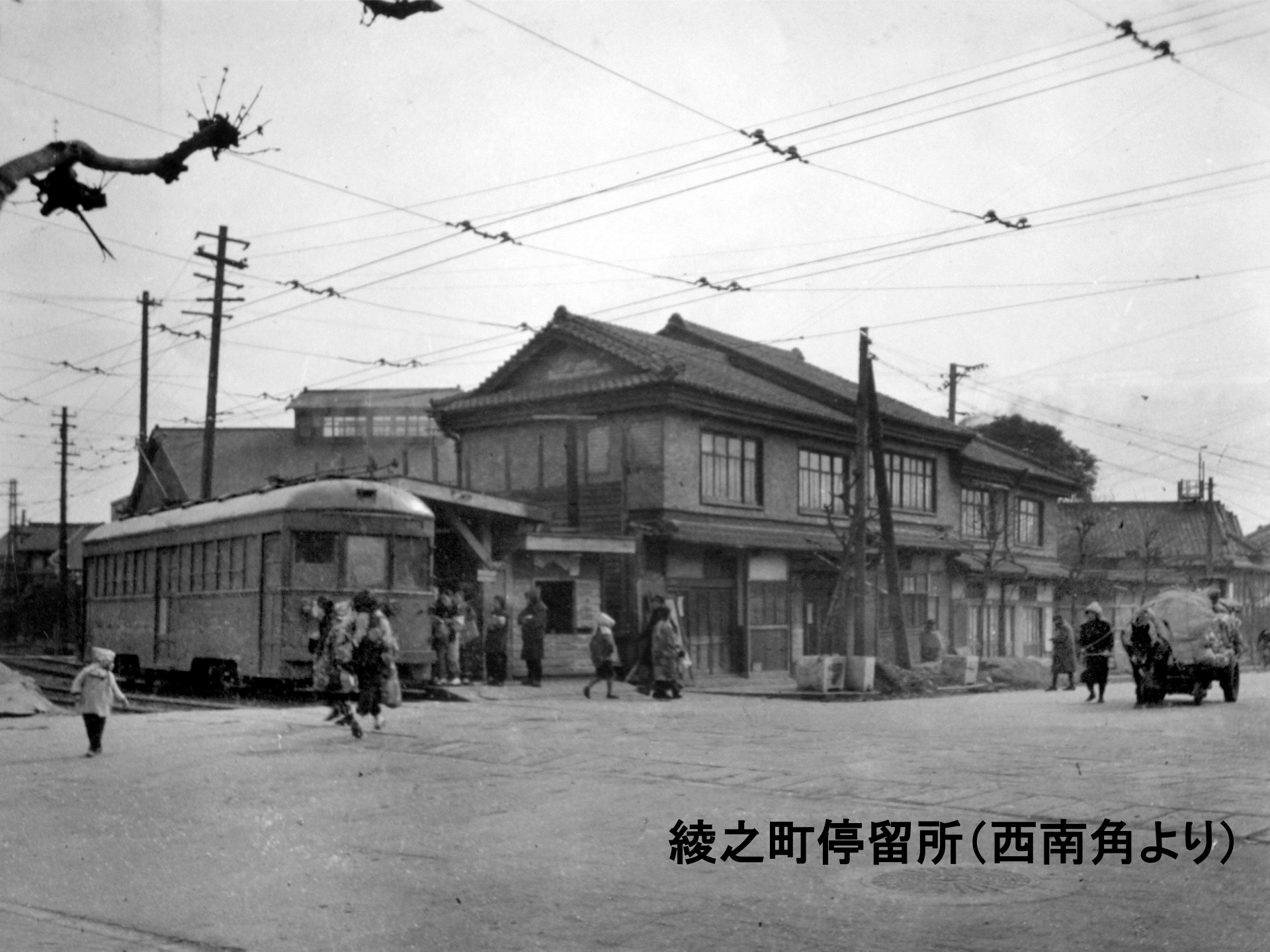
綾之町停留所(西南角より)