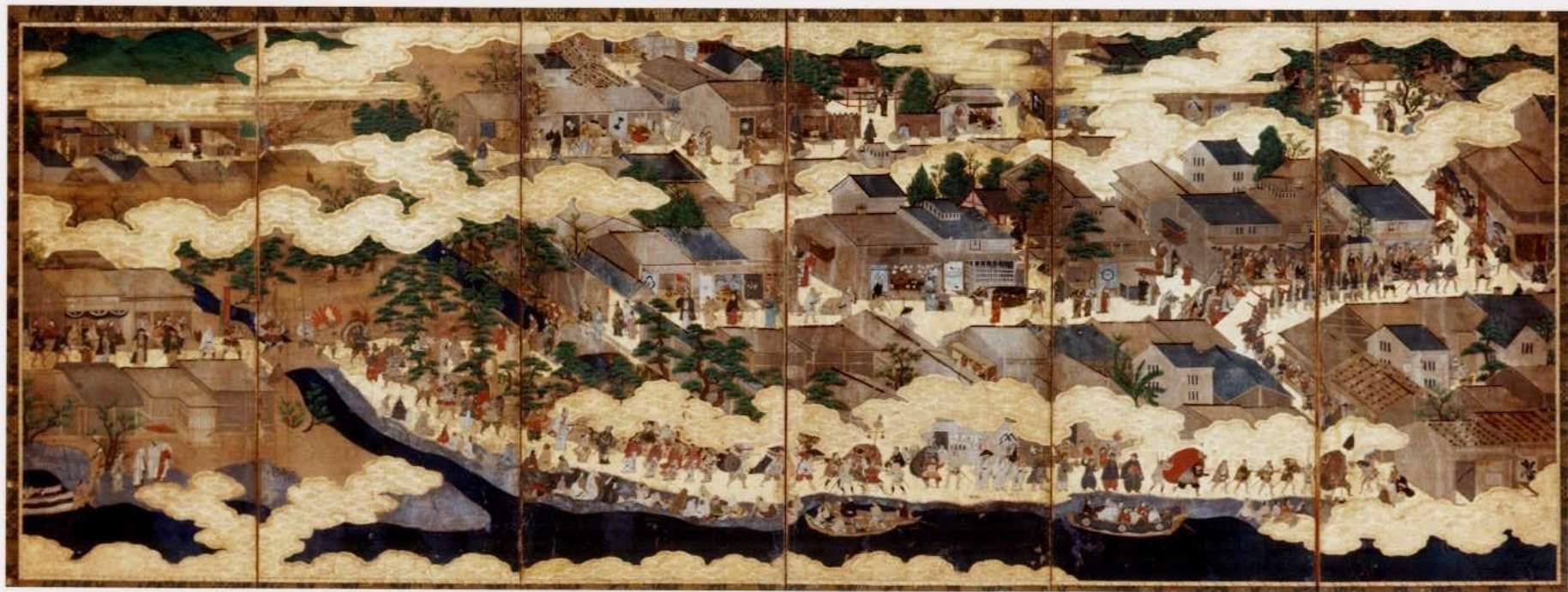
堺市指定有形文化財 住吉祭礼図屏風 江戸時代前期