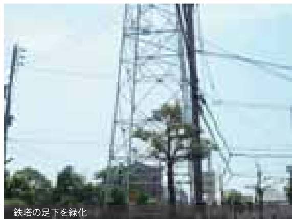
鉄塔の足下を緑化