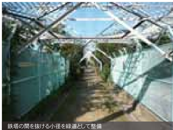
鉄塔の間を抜ける小径を緑道として整備