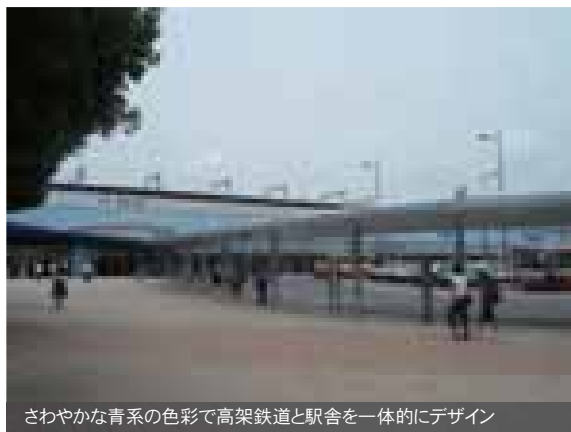
さわやかな青系の色彩で高架鉄道と駅舎を一体的にデザイン