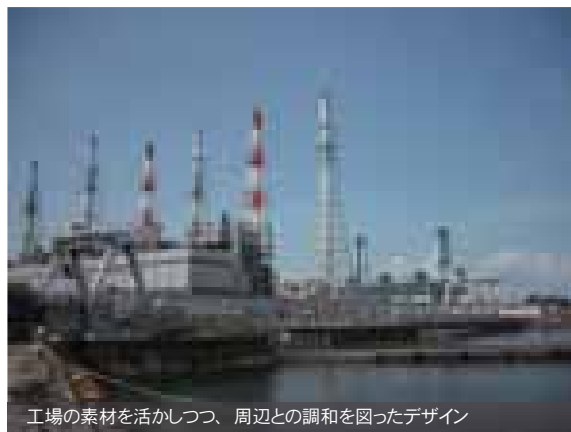
工場の素材を活かしつつ、周辺との調和を図ったデザイン