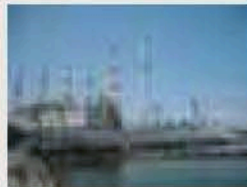
臨海地域のダイナミックな工場群