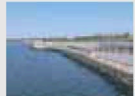
親水臨岸と緑地(堺2区)