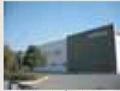
整ったデザインの工場