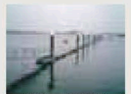
堺浜シーサイドマリナー