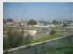
谷あいの集落と田畑