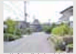
竹城台の住宅地のまちなみ