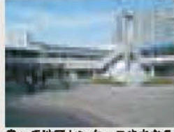
泉ヶ丘地区センターのまちなみ