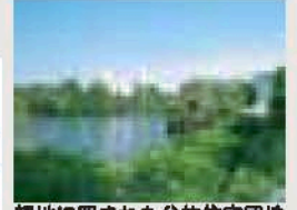
緑地に囲まれた公的住宅団地