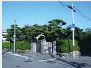
上野芝町のまちなみ