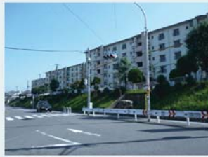
堀上緑町の公的住宅団地のまちなみ