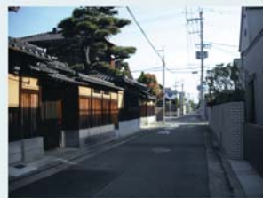
浜寺昭和町のまちなみ