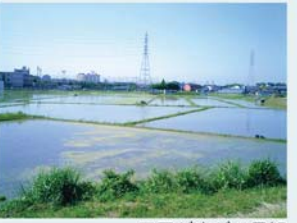
田園が広がる景観