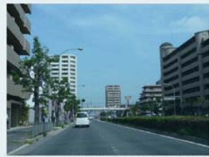
大阪高石線（常磐浜寺線）