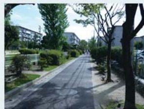
新金岡町の公的住宅団地のまちなみ