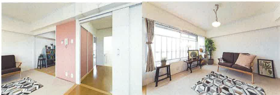
プランの一例 「ぐるり」（泉北鴨谷台三丁団地）