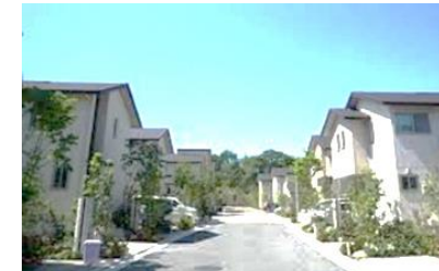
①環境配慮型の先導的な住宅イメージ (SMA×ECO TOWN晴美台)