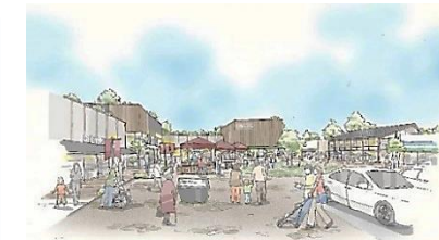
②ライフスタイル提案型商業施設イメージ