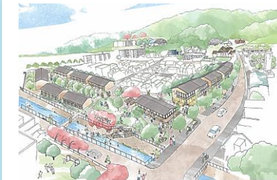
③木造低層等の新たなデザインイメージ (大東市morinekiプロジェクト イメージパース)