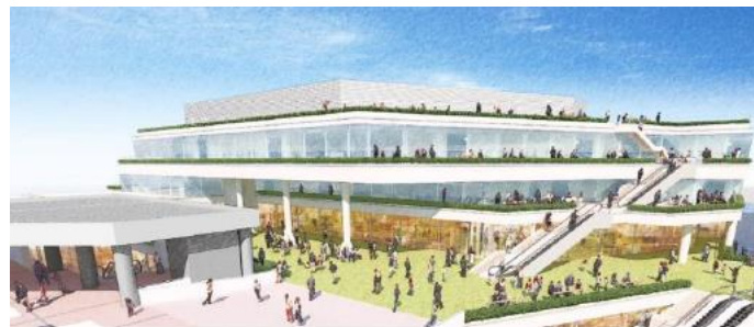
①シンボルコア (南海電鉄商業ビルの建替)