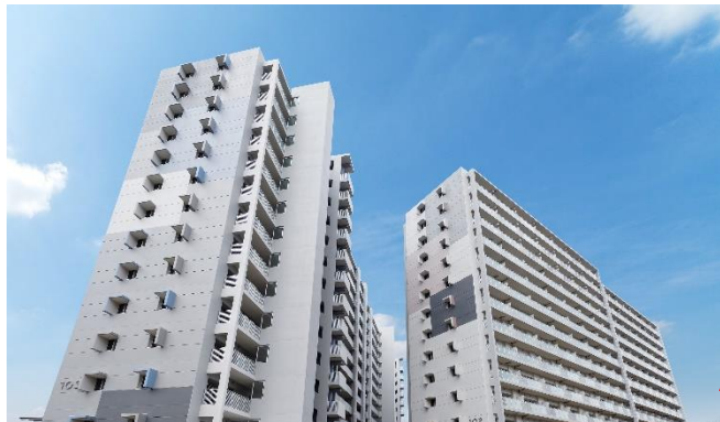
⑦ネクストコア3 (UR泉北竹城台一丁団地の建替・活用地)