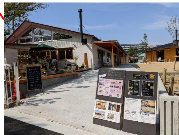
⑤ネクストコア1 (大阪健康福祉短期大学の開学)