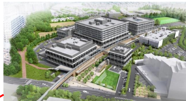
②教育・健幸コア (近畿大学医学部等の開設)