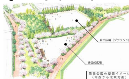
②教育・健幸コア (田園・三原公園等の再整備)