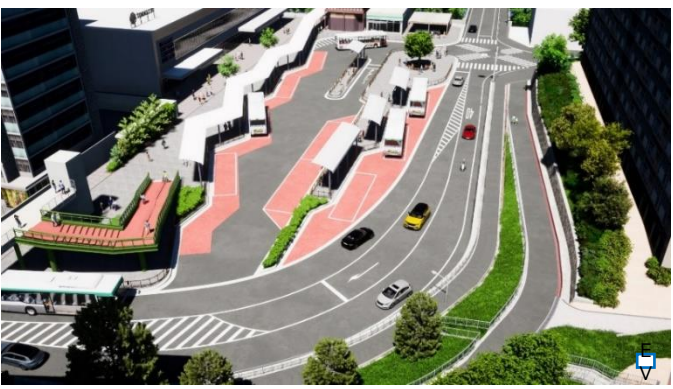
南側駅前広場イメージバス ※イメージバスと実際の完成は異なる可能性があります。

南側駅前広場は、公共交通機能（路線バス・タクシー）を確保し、一般車の不法駐車を抑制する形状への再編により、交通の輻輳・交錯を緩和歩道の幅員を拡げ、安全・安心な歩行空間を確保 バス降車場を駅前広場に確保し、利便性を向上