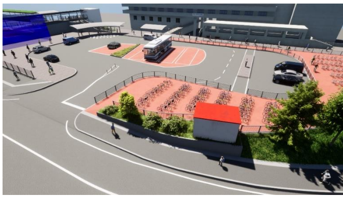
北側駅前広場イメージバス ※イメージバスと実際の完成は異なる可能性があります。

北側駅前広場は、一般車のキッス&ライドスペースや駐車を確保し、一般車の利便性を高め、交通結節点としての機能を向上 駅前広場の一部を活用し、駅前広場利用者の便益を向上する施設を誘致し、駅前の賑わいを創出