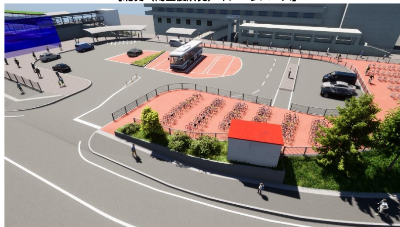
【南側（トナリエ側）イメージパース】