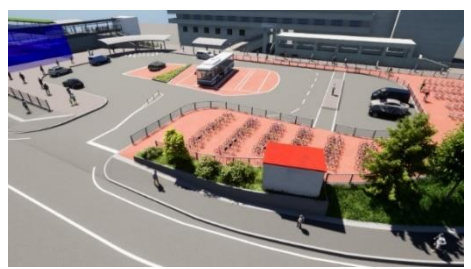
北側駅前広場イメージパース

整備方針 ・北側駅前広場は、一般車のキス&ライドスペースや駐車場を確保し、一般車の利便性を高め、交通結節点としての機能を向上 ・駅前広場の一部を活用し、駅前広場利用者の便益を向上する施設を誘致し、駅前の賑わいを創出