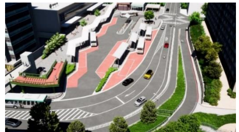
南側駅前広場イメージパース

整備方針 ・南側駅前広場は、公共交通機能（路線バス・タクシー）を確保し、一般車の不法駐車を抑制する形状への再編により、交通の輻輳・交錯を緩和 ・歩道の幅員を拡げ、安全・安心な歩行空間を確保 ・バス降車場を駅前広場に確保し、利便性を向上