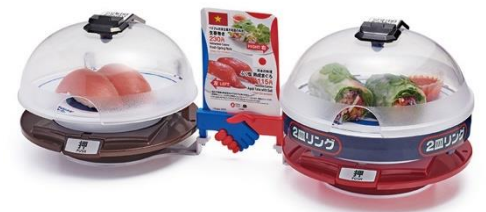
連結部分に握手のモチーフを採用した 特別仕様の「鮮度くん」 （※商品はイメージ）

また、くら寿司の全店舗を対象としたフェアではなく、取扱店舗を限定して実施する予定です。また、フェア実施時期は未定です。