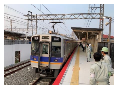
仮上りホームの利用開始