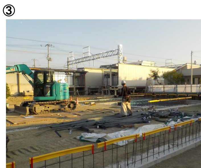
仮駅舎の基礎工事を実施しています。