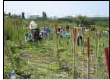
図 共生の森植栽活動