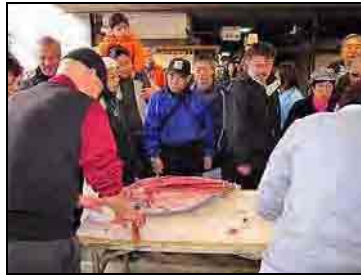
図 堺旧港観光市場