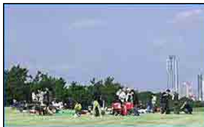
図 海とのふれあい広場