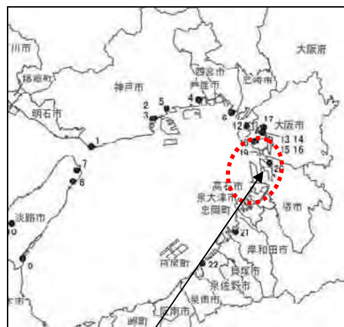
堺浜商業 アミューズメント施設