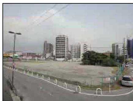
図 堺旧港の未利用地

以上より、堺臨海部における社会活動の観点からみた現状としては、 多数の歴史文化資源を有し、市民等による各種活動が実施されつつあるものの、市民・来訪者にとって魅力のある憩い・賑わいの場が不足している ことです。