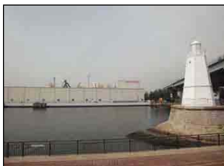
図 周辺と調和が必要な高架道路や工場群