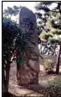
図 大浜公園内の歴史・文化資源（擁護壘、蘇鉄山、復元されたラジオ塔）