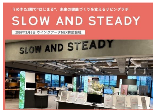
【話題提供資料（ウイングアーク NEX(株)）】