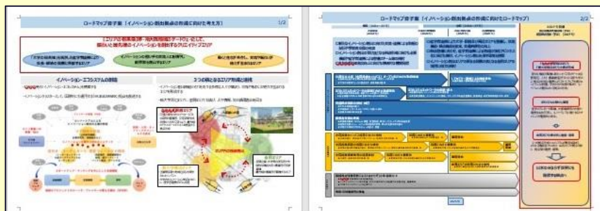
ロードマップ骨子案