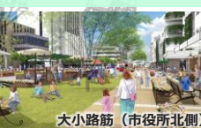
大小路筋（市役所北側）