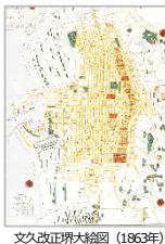
文久改正堺大地図（1863年） 堺市立図書館蔵