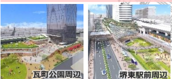
瓦町公園周辺 堺東駅前周辺