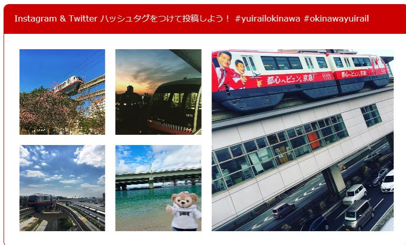
ハッシュタグの活用