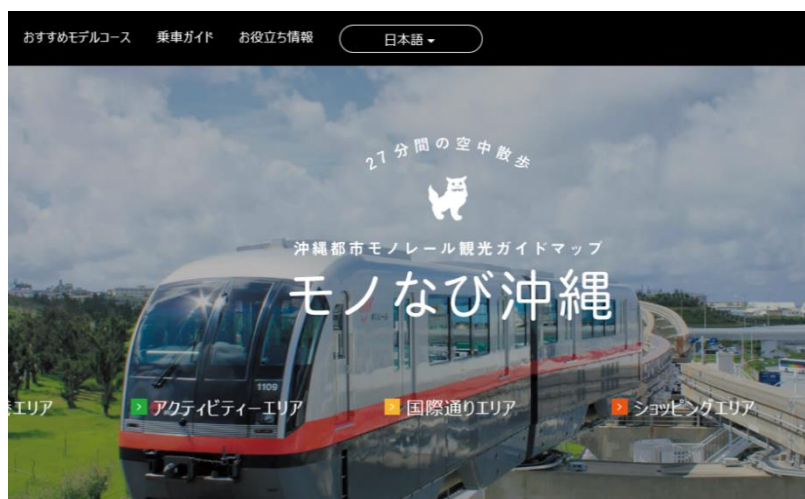
Web観光ガイドマップ