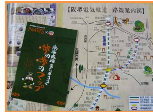
観光路線図(まちあるきマップ等)の作成