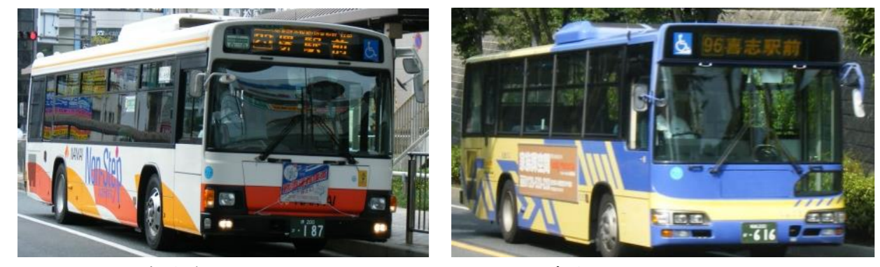
南海バス 近鉄バス