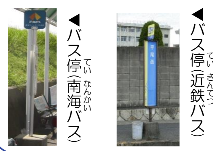
バス停(南海バス) バス停(近鉄バス)