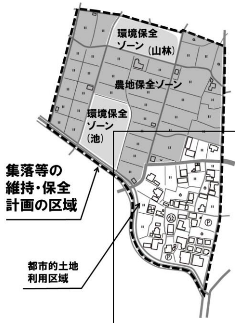
集落等の維持・保全計画のイメージ図