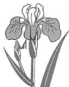
市の花 「ハナショウブ」