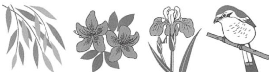
市民の木 「柳」 市の花木 「ツツジ」 市の花 「ハナショウブ」 市の鳥 「モズ」