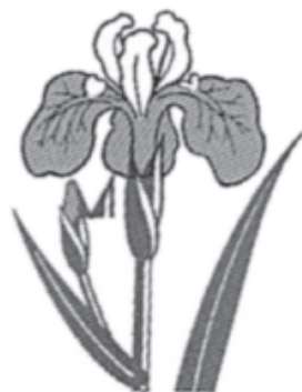
市の花 「ハナショウブ」