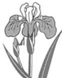
市の花 「ハナショウブ」