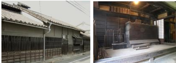
井上関右衛門家住宅（歴史的風致形成建造物）