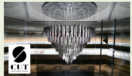
刃物の製造工程で表現したシャンテリアと堺刃物ミュージアムの様子

税込 5,000 円以上の購入で送料無料 となりますので、ご家庭用や贈り物などにご利用ください。