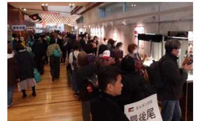
2 ヨルダンパビリオンの砂の展示