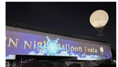
DAISEN Night Balloon Festa

▶ 世界遺産、茶の湯文化、伝統産業等の歴史文化資源を万博レガシーとして活用しながら、観光誘客の取組を強化