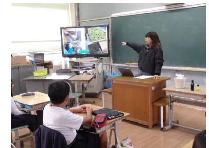
4 会員企業による「万博会場でのSDGsに関する取組」の出前講座