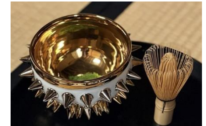
2 新たな茶の湯体験 (アート茶会)