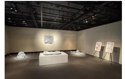
1 ポルトガルと連携した作品展示

・子どもたちはとても喜んでいて、海外の文化や言葉を知り、身近に感じる良い機会になった。