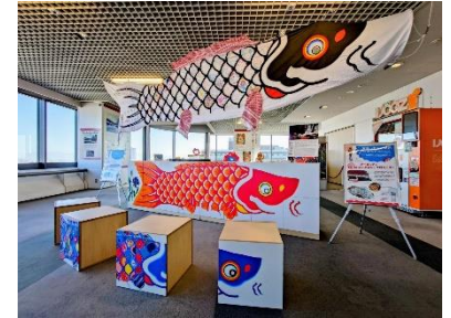
1 万博レガシー展示