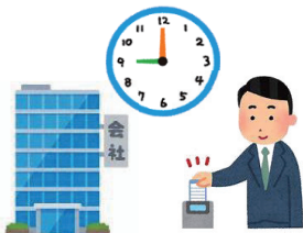
はじ 始まります hajimarimasu