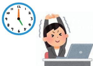
お 終わります owarimasu