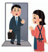
かえ 帰ります kaerimasu