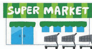
すーぱー スーパー suupaa