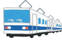
でんしゃ 電車 densha