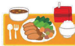
ひる はん 昼ご飯 hirugohan