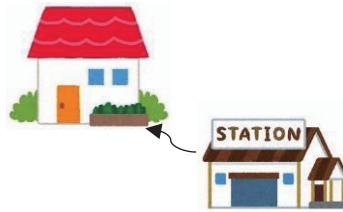
とお 遠い tooi