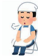
やす 休みます yasumimasu