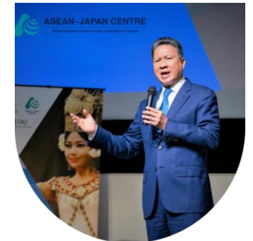
写真: カンボジア投資フォーラムでのスンチャントール副首相