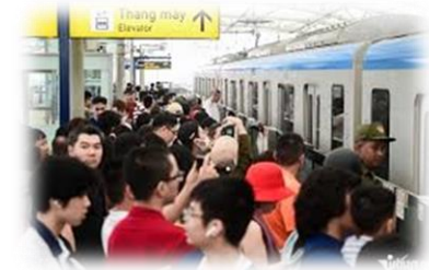
写真: 2024年12月に開業したホーチミン メトロ1号線