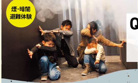
煙・暗闇 避難体験

「真・体験」の“真”の文字には、「真に必要な知識・技術を習得してほしい」という意味が込められています。さまざまな体験や映像・パネル展示を通じて、堺で予想される地震や津波など、いつ起こるか分からない災害の実態を紹介しています。(約1時間30分)