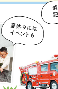
夏休みにはイベントも