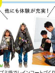
ゴミ袋でレインコートづくり