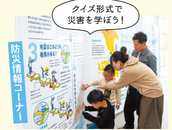
クイズ形式で災害を学ぼう!