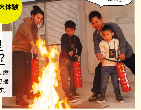
屋外で使う場合は 風上から狙おう!