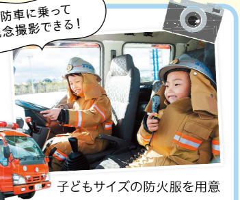
消防車に乗って記念撮影できる!