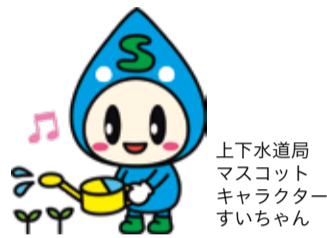
上下水道局 マスコットキャラクター すいちゃん

水道水は衛生確保のため塩素消毒をしていますが、3日程度使われず水道管内にとどまっていると、消毒効果が弱まる場合があります。長期間水道を使わなかった場合、使い始めはバケツ1杯程度の水を飲み水以外に使ってください。