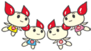
献血キャラクター けんけつちゃん