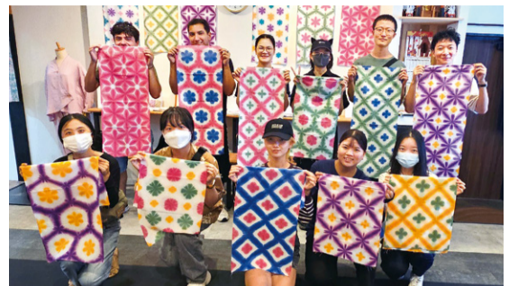
外国人留学生向けの注染体験イベントの様子