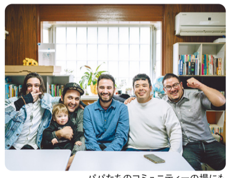
パパたちのコミュニティの場にも