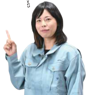
資源循環推進課職員