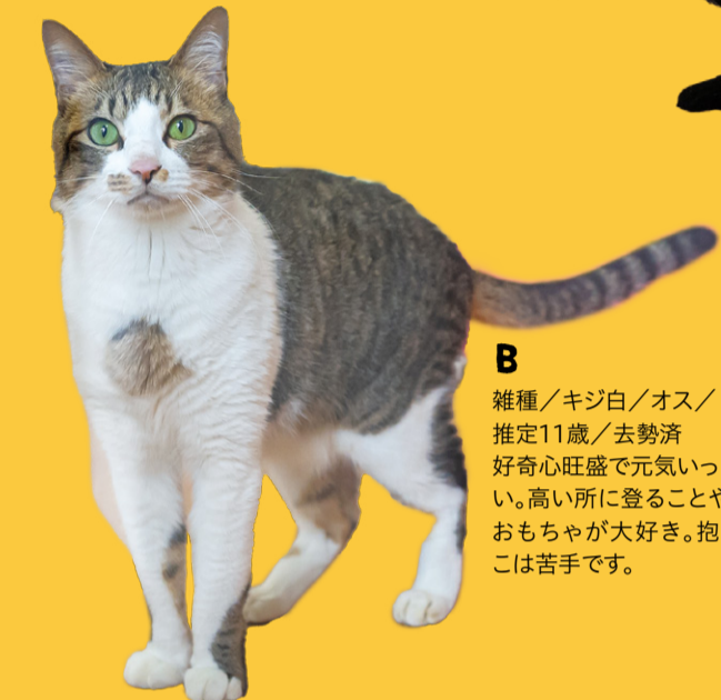
B 雑種/キジ白/オス/推定11歳/去勢済 好奇心旺盛で元気がいっぱい。高い所に登ることや、おもちゃが大好き。抱っこは苦手です。