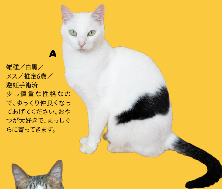
A 雑種/白黒/メス/推定6歳/避妊手術済 少し慎重な性格なので、ゆっくり仲良くなってあげてください。おやつが大好きで、まっすぐに寄ってきます。