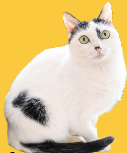
C 雑種/白黒/メス/推定6歳/避妊手術済 やや怖がりさんなので、ゆっくり仲良くなってあげてください。おやつを食べている時が触るチャンスです。