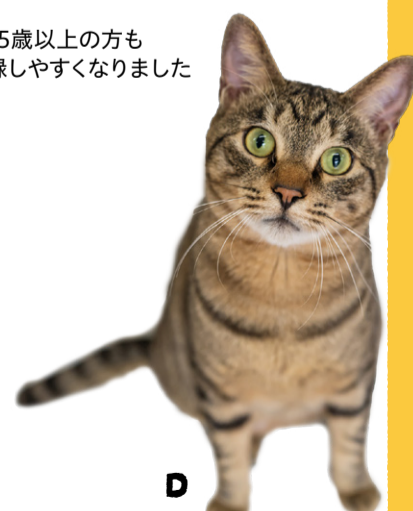
D 雑種/キジトラ/オス/推定4歳/去勢済 人が大好きで、座るとすぐに膝の上に乗ってきます。ゴロンもお手のもの!