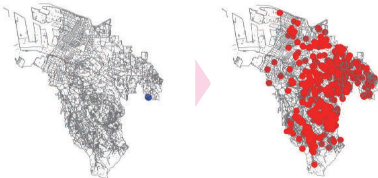
被害状況地図（平成28年3月時点）

市では平成28年に美原区内で初確認され、令和6年6月時点では市内全域で生息が確認されています。